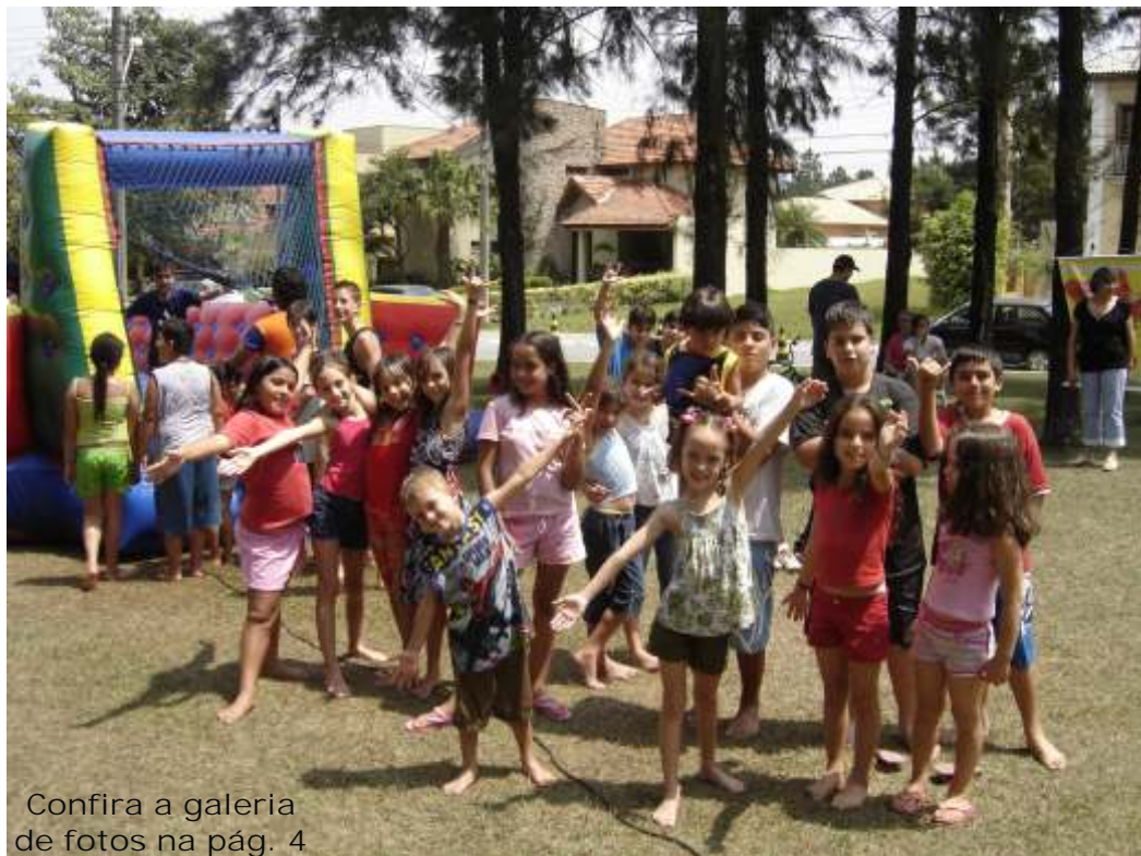
Confira a galeria de fotos na pág. 4