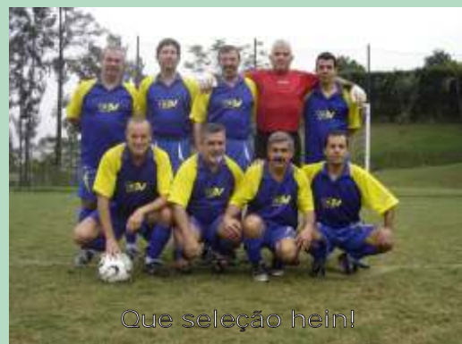
Que seleção hein!

Valeu meninos! Conquistamos o nosso objetivo que foi a integração com outros condomínios por meio do esporte. Até o próximo campeonato em 2008.