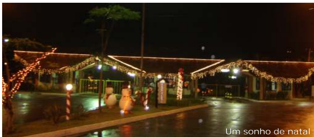
Um sonho de natal