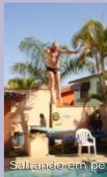
Saltando em pé