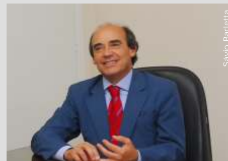
Benedito Fernandes Prefeito de Santana de Parnaíba

Prefeito. Esse é o meu último ano como prefeito de Santana de Parnaíba, portanto quero aproveitar a ocasião para agradecer o apoio de vocês em todas as ações da prefeitura. Quero agradecer aos fiéis colaboradores da Assistência Social e do Fundo Social de Solidariedade do município em importantes ações, como o Bota-Fora, a Campanha do Agasalho, entre tantas outras. Que Deus continue iluminando o caminho de cada um de vocês. Muito obrigado.