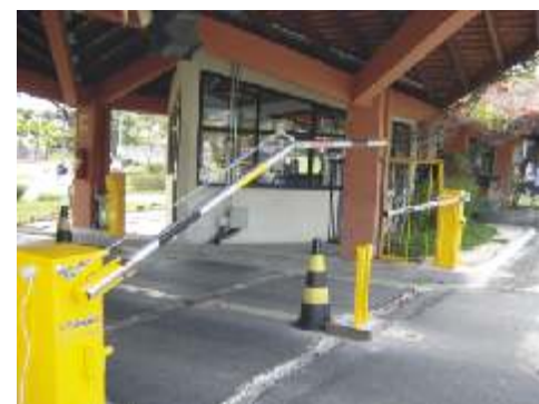
As cancelas já funcionam, o piso está sendo preparado para receber a fiação do sistema

comportamentais dos seres vivos. Recentemente este termo também foi associado a medida de características físicas ou comportamentais das pessoas como forma de identificá-las unicamente. Hoje a biometria é usada na identificação criminal, controle de ponto, controle de acesso, etc. Os sistemas chamados biométricos podem basear seu funcionamento em características de diversas partes do corpo humano, por exemplo: os olhos, a palma da mão, as digitais do dedo, a retina ou íris dos olhos. A premissa em que se fundamentam é a de que cada indivíduo é único e possui características físicas e de comportamento ( a voz, a maneira de andar, etc. ) distintas.