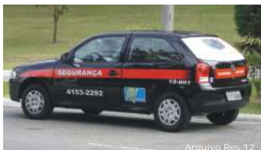
Arquivo Res. 12