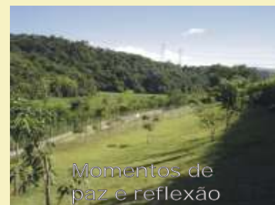
Momentos de paz e reflexão

Uma sugestão de passeio, em nosso próprio Residencial, é a fantástica paisagem que pode ser observada do canil, localizado ao lado da quadra de tênis. Quem chegar até o local terá, com certeza, alguns momentos de paz e reflexão proporcionados pelo silêncio da reserva natural de Mata Atlântica. Um verdadeiro show da natureza em nosso quintal. Não deixe de visitar!