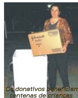
Os donativos beneficiam centenas de crianças

A próxima reunião do Voluntariado do Residencial 12 será no dia 14/09, às 14h30 no salão de festas. Todos os moradores interessados em colaborar estão convidados.